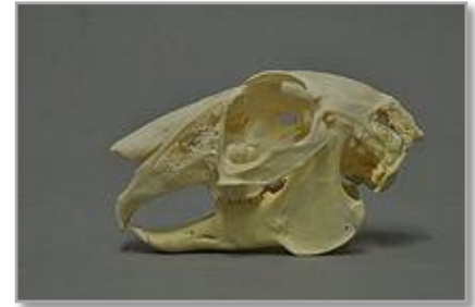
Schädel des Lepus europaeus

Der Feldhase ( Lepus europaeus ) ist ein Säugetier aus der Familie der Hasen (Leporidae). Die Art besiedelt offene und halboffene Landschaften. Das natürliche Verbreitungsgebiet umfasst weite Teile der südwestlichen Paläarktis; durch zahlreiche Einbürgerungen kommt die Art heute jedoch auf fast allen Kontinenten vor. Aufgrund der starken Intensivierung der Landwirtschaft ist der Bestand des Feldhasen in vielen Regionen Europas rückläufig. Die Schutzgemeinschaft Deutsches Wild erklärte den Feldhasen für das Jahr 2015 zum Tier des Jahres.